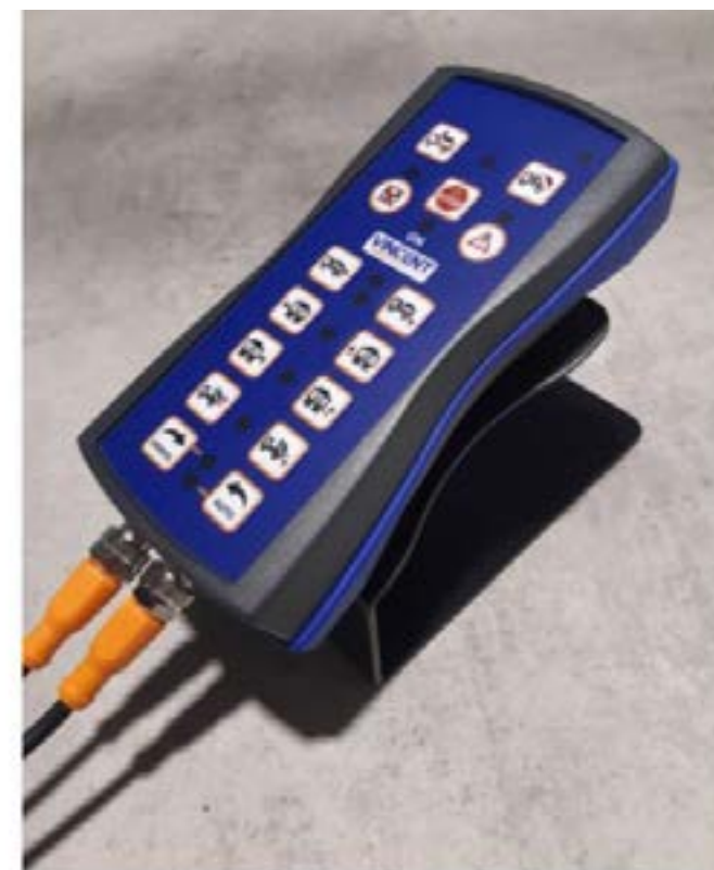
Et plus de la fonction d'alerte, la commande électrique permet une manipulation centralisée de tous les éléments de la benne.

Après avoir testé et validé sa commande électrique dans des conditions d'utilisation extrêmes l'an dernier, Bennes Vincent propose ce dispositif (ergonomie compacte, branchement Plug & Play) sur toutes ses bennes neuves. Par ailleurs, pour les véhicules déjà en circulation, le carrossier propose une solution : "Ils peuvent être équipés, dans nos ateliers, d'une carte électronique facilitant la mise en place des alertes désormais requises", indique Bennes Vincent.